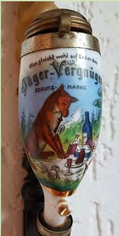
Pijprokende vos (pag.12)