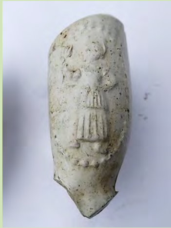
Meisje met de bloem (pag. 4)