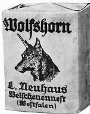
Afb. 6. Wolfshorn tabak van L. Neuhaus, Welschenennest.