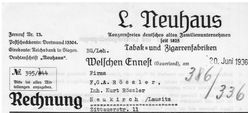
Afb. 5. Briefhoofd L. Neuhaus, Welschen Ennest, 1936.

7 tot DM 11 voor pijpen met een lengte van 105-110 cm. Ook in de catalogus van de pijpfabriek C.H. Bock Söhne in Lügumkloster uit de periode 1912-1919 vinden we deze pijpen terug. 16